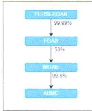
Gambar Struktur Pemegang Saham per Mei 2024